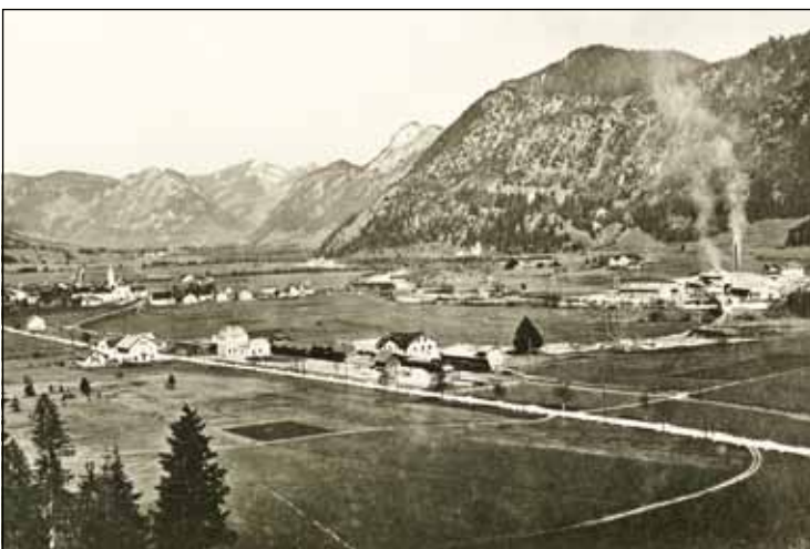
Vilsansicht um 1915 (aus: Chronik der Stadt Vils)